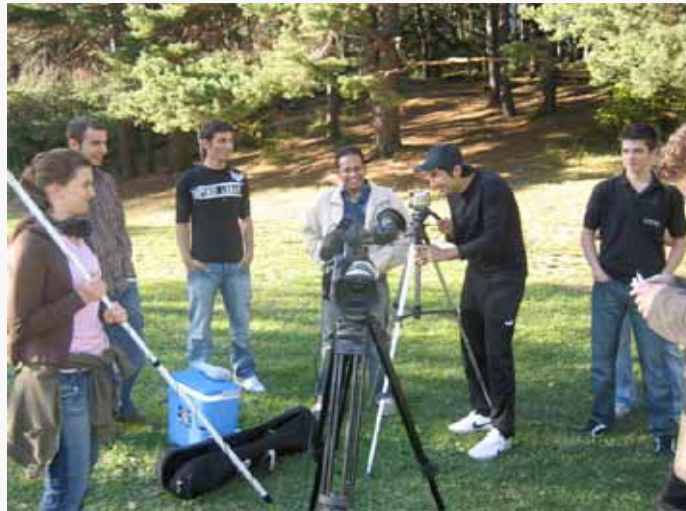
Videoworkshop Have a break, have a Ülker