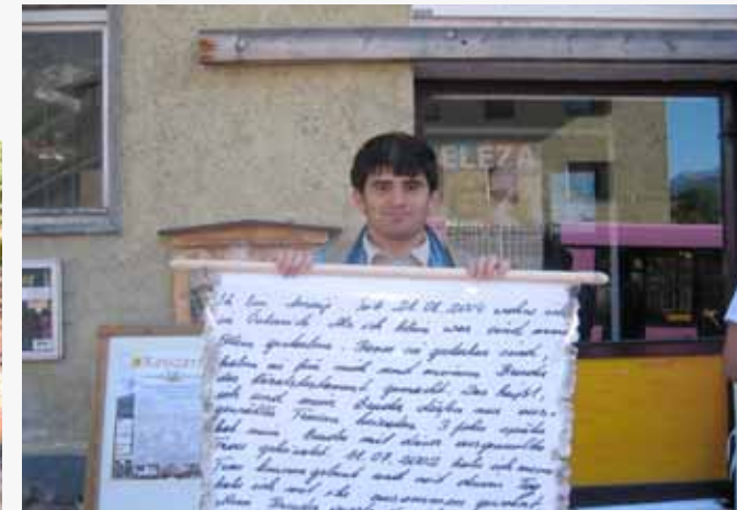
Schreibwerkstatt & Schildermacher