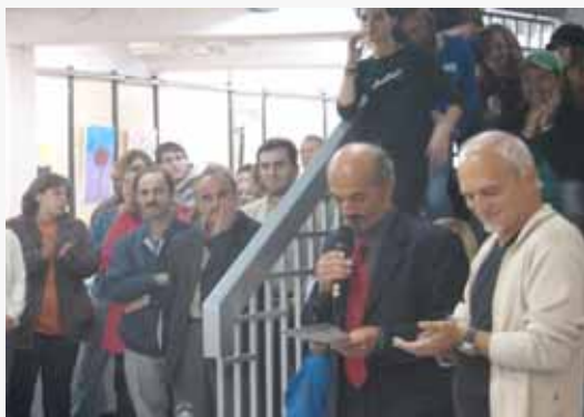
Bürgermeister Engelbert Stenico bei der Vernissage