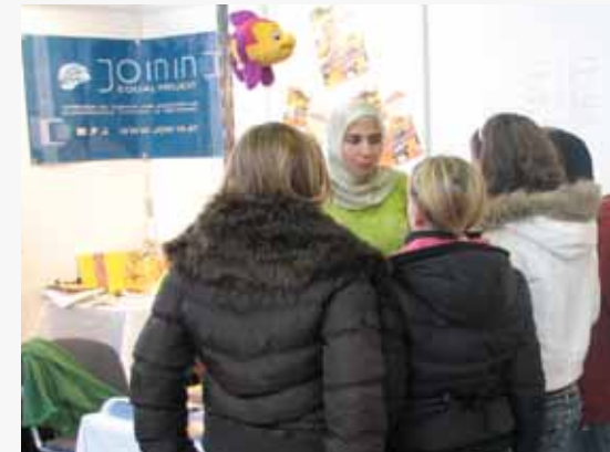
Bildungs und Berufsmesse für MigrantInnen