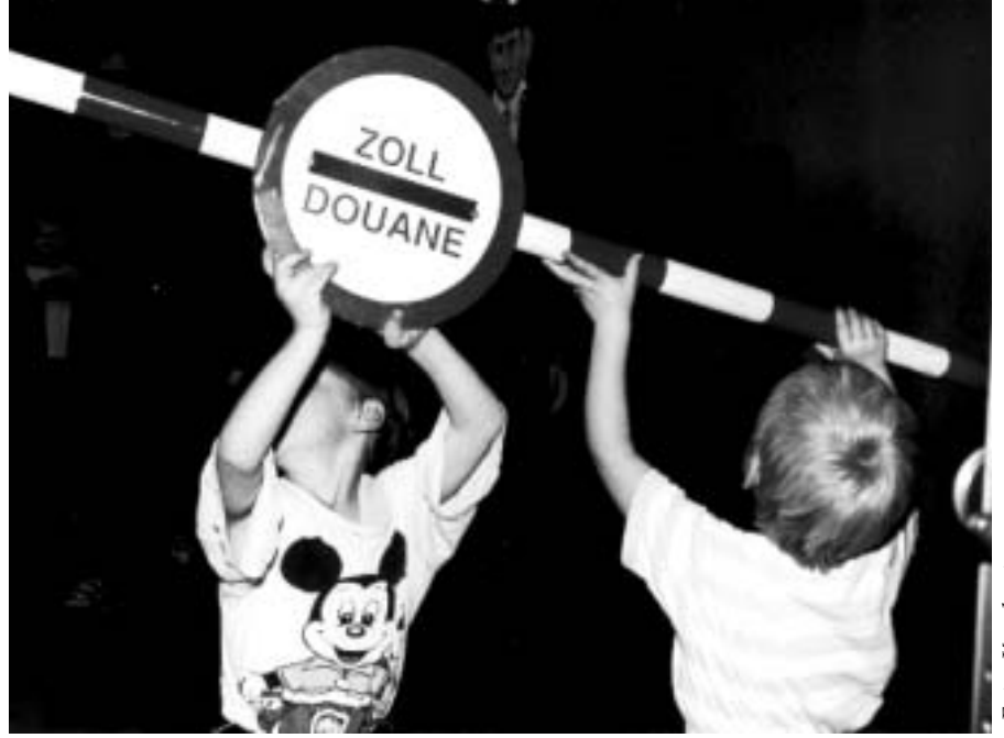
Konu olan hem sistemdeki hem de kafalardaki bariyerlerdir

Geçen yıl tarafımızdan 7 ilçede 30 tane Almanca kursu (17 Almanca kursu Sonbaharda, 13 tanesinde İlkbaharda) gerçekleştirildi. Daha geniş ve kapsamlı Almanca kursları düzenlemek için, Eylül 2000 den itibaren BFİ (Mesleki geliştirme Enstitüsü) ve VHS AK (İşçi Odası'nın Halk yüksek okulları) ile beraber Lisan taarruzu başlatıyoruz. Amacımız özellikle göçmen İşçilere