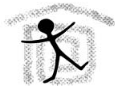
Od 1994 do 1998 imali smo ovaj znak

U tu svrhu pripremili smo različite projekte koje nastojimo da realiziramo zajedno sa našim kooperacijskim partnerima.