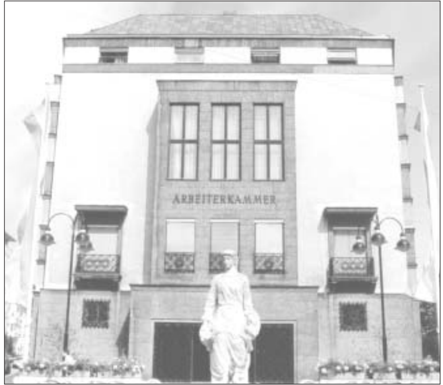
Seçime katılma oranı ne kadar yüksek olursa, o kadarda işçi odası kendi üyelerini temsil etme gücüne sahip olabilir.

• Her büyük işletme en azında bir seçim alanı oluşturarak kendi seçim bürosunu kurabilir. Bu işletme seçim bürosunda farklı zamanlarda seçmen oyunu kullanabilir. Eğer seçmen bu seçim süresi boyunca herhangi bir nedenden dolayı seçime katılamıyorsa,