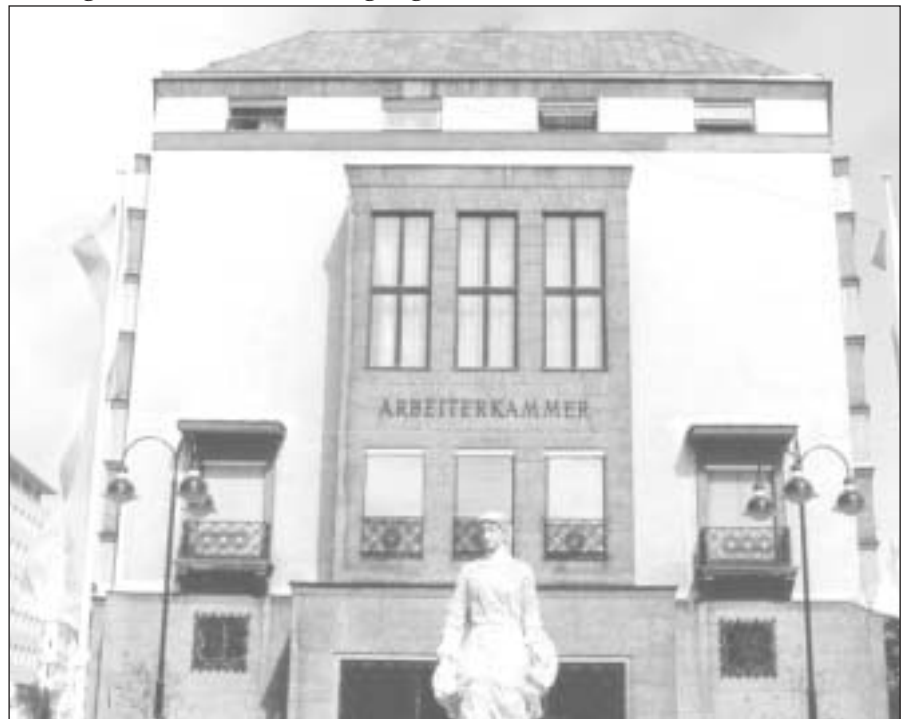
Je höher die Wahlbeteiligung ausfällt, desto "stärker" kann die AK ihre Mitglieder vertreten.

während es bei der Landwirtschaftskammer S 16.000,- und bei der Wirtschaftskammer S 20.000,- sind. Auch bezüglich der Mitgliederzahl ist die AK voll ausgelastet