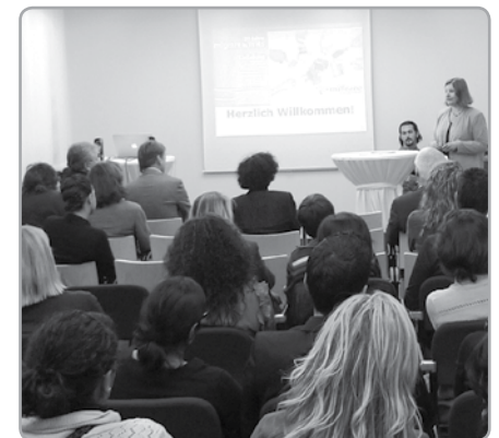
Im November 2011 feierte unsere Beratungsstelle in Wels ihr 20-jähriges Jubiläum.

Unsere Beratungen sind vertraulich und kostenlos.