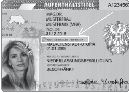
Vizenin tarihine dikkat ediniz!