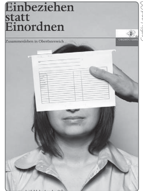
Grafik: Land ÖÖ

Gelecek yıllarda onun sadece kağıttan daha fazla bir şey ifade edip etmediği kendini gösterecek. Şimdiden itibaren önerilen ve tabii ki paraya mal olacak tedbirlerin yerine getirilmesi olacak. Sorumlu politikacıların partilerine bağlı olup olmadıklarına bakılmaksızın gerçekten bu konuda birlikte hareket edip etmedikleri, somut tedbirlerle Y. A. da positif bir birlikte yaşamı destekleyip desteklemedikleri ve göç-