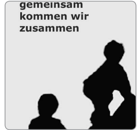
Entegrasyon Raporunun başlığı

Yerel siyaset ve yönetim entegrasyon konusu için belirgin bir siyasi yükümlülük ve sorumluluk üstlenmelidir. Bunun dışında göçmenler medyada beraber şekillendirilenler olarak ve entegrasyonun teşviki için anahtar olarak görülmelidir.