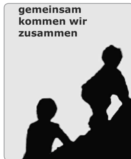
Die Titelseite des Integrationsberichtes

Auch im Bereich der Kommunalpolitik schlagen die ExpertInnen konkrete Schritte vor, wie z.B. die Schaffung von zusätzlichen Begegnungsmöglichkeiten, um zu erreichen, dass sich die zugewanderten Menschen mit ihrer neuen Heimat identifizieren können. Kommunale Politik und Verwaltung müssen eine klare politische Verbindlichkeit und Verantwortung für das Thema "Integration" übernehmen. Darüber hinaus sollte es Ziel sein, die Mitgestaltung von MigrantInnen im Medienbereich zu fördern.