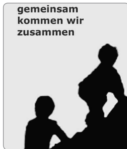
Naslovna strana integracijskog izvještaja