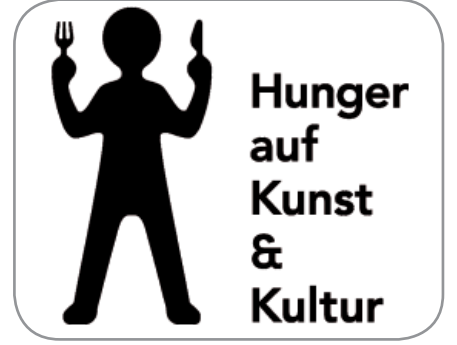
Aksiyonun resmii afişi

Kültür pasosu alma hakkınız olup olmadığını, hangi etkinlikleri ve kuruluşları kültür pasıyla parasız ziyaret edebileceğinizi öğrenmek istiyorsanız,