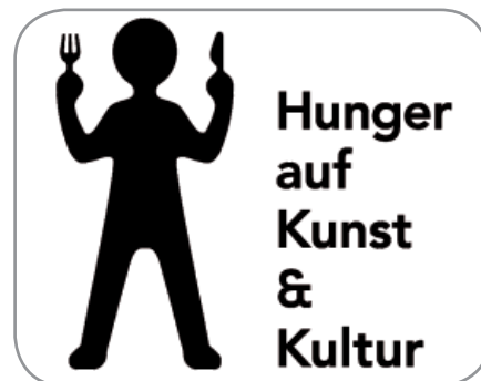
Das offizielle Plakat der Aktion

Wenn Sie wissen wollen, ob Sie Anspruch auf den Kulturpass haben, welche Veranstaltungen und Ein-