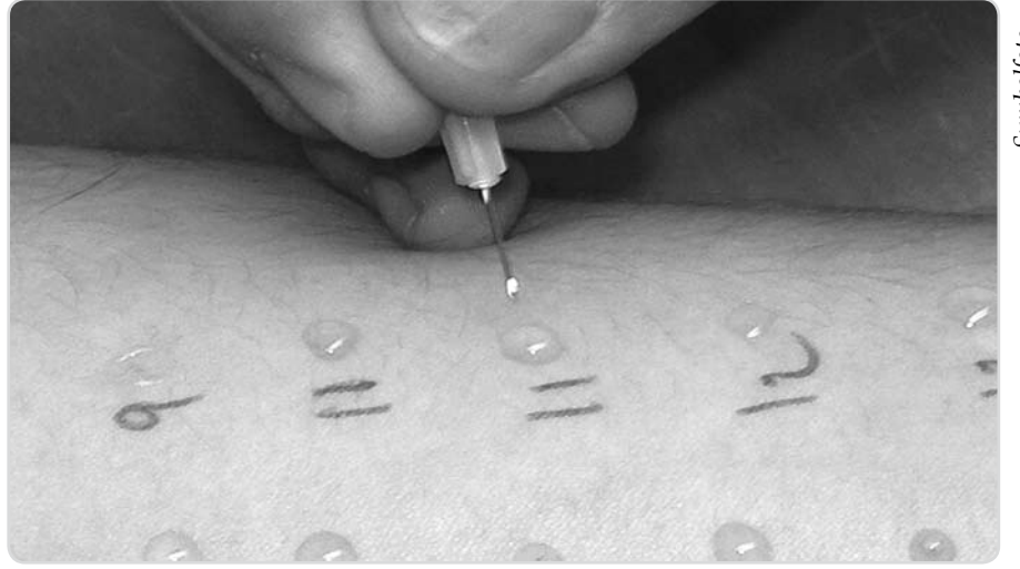
Hastalığı~tesbinde en emin yollardan birisi "Prick" testidir.