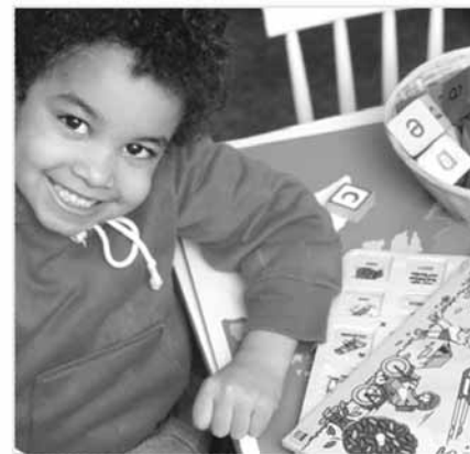
Grafik: V. Lujic-Kresnik

DAVETIYE SİZ DE BERABER KUTLAYINIZ! Eğlence »migrare 20 yaşında« 4. Kasım 2005 Linz Belediyesi salonunda saat 18:30 den itibaren »JAZZWA« müzik grubuyla büyük konser.