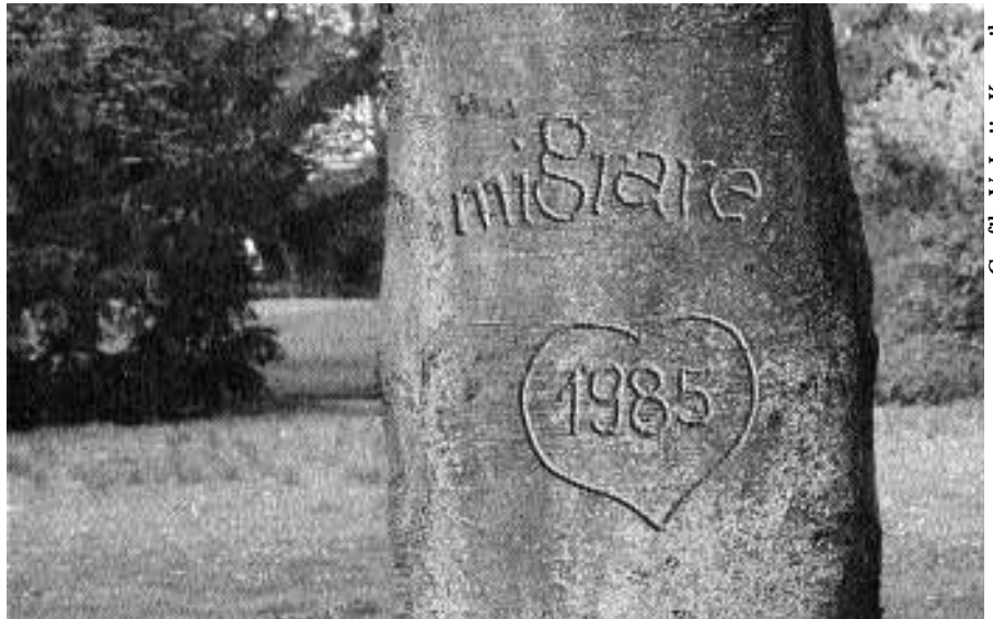
Grafik: V. Lujic-Kresnik

2004 yılında göçmen ilişkili, kültürler arası uzmanlığa ve iki lisana sahip danışmanlarımız bütün Yukarı Avusturya`da 18.167 kişiye danışmanlık (2003 yılında 17.114) hizmeti sundular ve 30.161 (2003 yılında 27.833) tek tek konularla ilgili bilgi verdiler. Bireysel danışmanın yanında geçen takvim yılında 7.709 kişiye telefonda bilgi verildi. Bütün danışmalar elektronik bilgi işlemi (EDV) vasıtasıyla kaydedilmektedir.