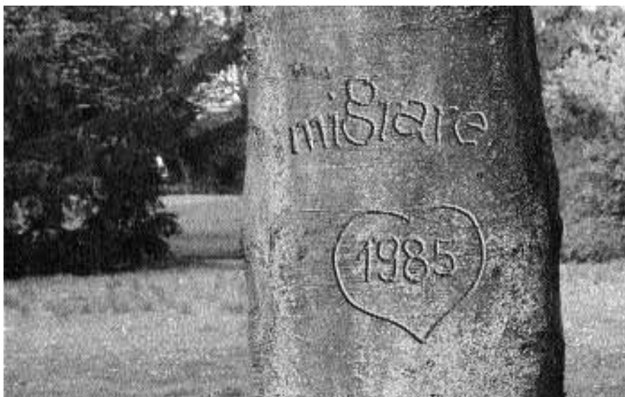
Grafik: V. Lujic-Kresnik

Im Jahr 2004 verzeichneten unsere BeraterInnen, die über eigenen Migrationsbezug, die interkulturelle Kompetenz und die Zweisprachigkeit verfügen, in ganz Oberösterreich 18.167 Beratungen (2003:17.114), in denen 30.161 (2003:27.833) Anfragen zu einzel-